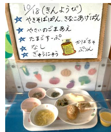
*ピンクのお皿はアレルギー対応食です